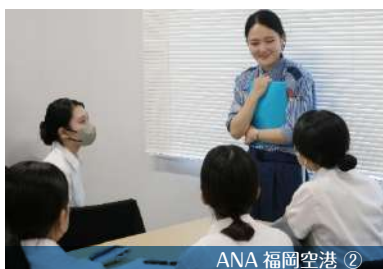
ANA 福岡空港 ②