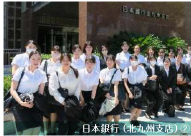
日本銀行（北九州支店）②