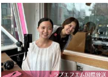
ラブエフエム国際放送