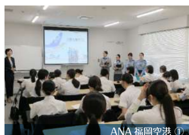
ANA 福岡空港 ①