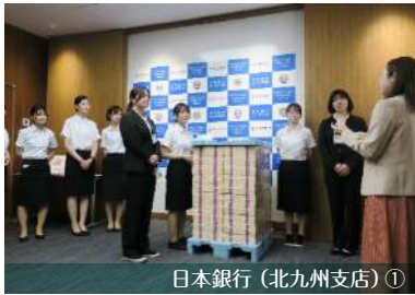
日本銀行（北九州支店）①