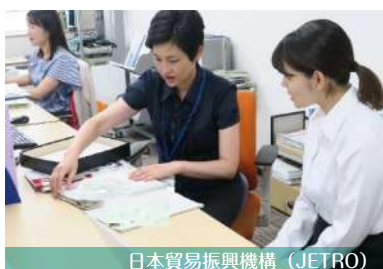
日本貿易振興機構 (JETRO)