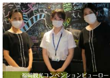
福岡観光コンベンションビューロー