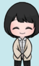
ふじむら まこと (指導教員)